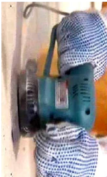
Рисунок 5 – Удаление пятен от битума, красок шлифовальной машиной

Пятна от битума, красок на водной и неводной основе, копоть удаляют растворителями или механическим способом (рисунок 5).