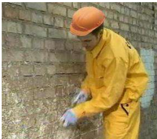
Рисунок 3 – Удаление отделочного слоя щеткой

Штукатурный слой удаляют зубилом и молотком (рисунок 4).