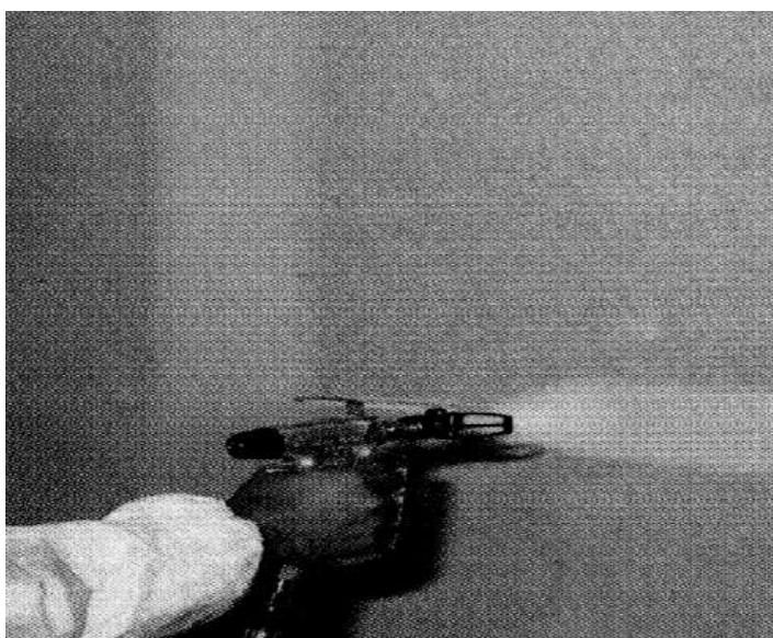
а - при помощи валика; б - при помощи краскопульты