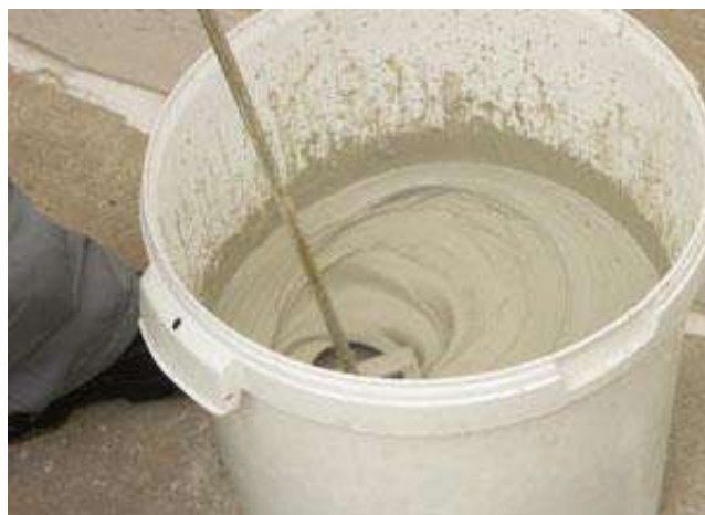
Рисунок 7 – Приготовление состава из сухой смеси и воды

4.2.3.4 Составы готовятся к применению при помощи низкооборотной дрели с насадкой-миксером (рисунок 7).