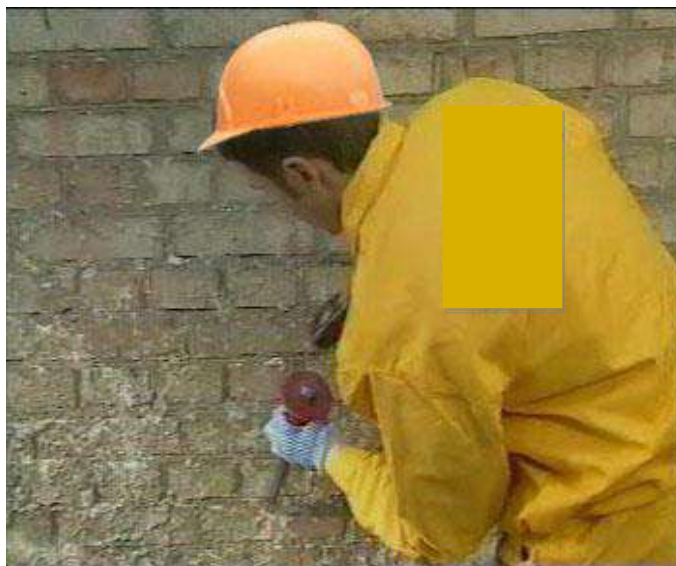
Рисунок 2 – Очистка поверхности зубилом и молотком

Срубку наплывов раствора, выступающих частей бетона, непрочных слоев основания выполняют вручную с помощью зубил, молотков с двойным заострением (рисунок 2), скarpелей.