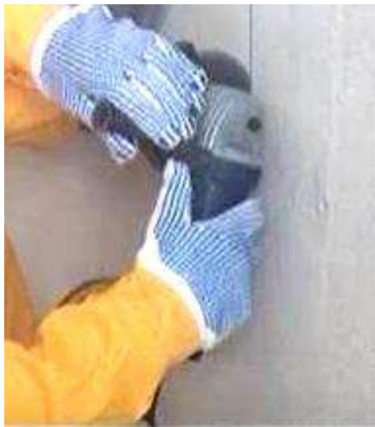
а - перфоратором; б - шлифовальной машиной с отрезным кругом