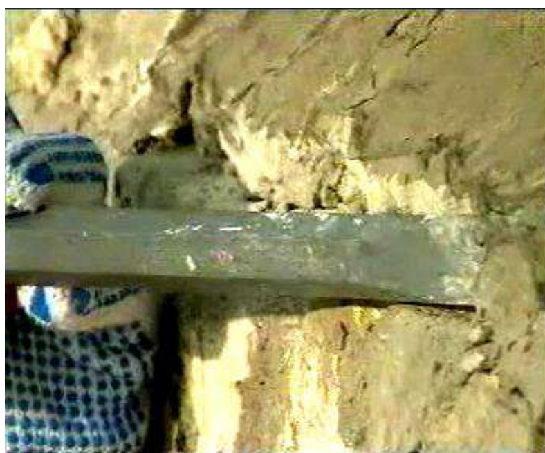
Рисунок 4 – Удаление штукатурного слоя зубилом

Штукатурный слой удаляют зубилом и молотком (рисунок 4).