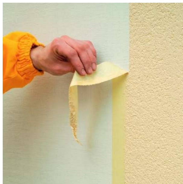
Рисунок 11 – Наклейка и снятие самоклеящейся ленты