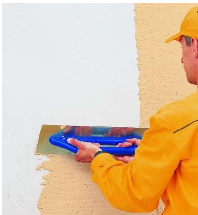
Рисунок 9 – Нанесение штукатурки металлической теркой

Для создания декоративно-защитного слоя с рельефной фактурой «шуба» приготовленный состав (по 4.2.3 данной ТТК) наносится на подготовленное и оштукатуренное основание при помощи металлической терки (рисунок 9) или шпателя толщиной до 5 мм.