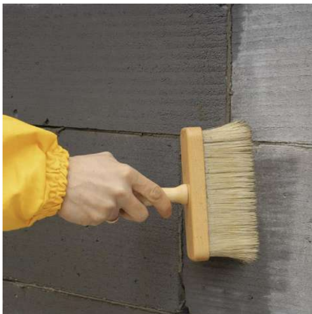
Рисунок 8 – Грунтование поверхности основания кистью

4.2.4.1 Приготовленный грунтовочный состав (согласно 4.2.3 данной ТК) наносится на поверхность подготовленного основания (согласно 4.2.2 данной ТК) при помощи щетки, кисти (рисунок 8), валика или распылителя за один или два раза сплошным тонким слоем.