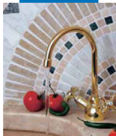
Пример заполнения швов в мозаике на кухне