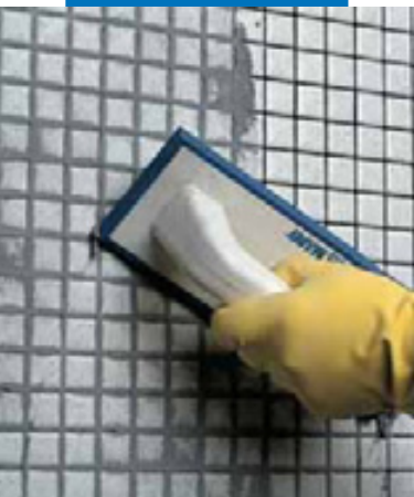
Заполнение швов в стеклянной мозаике (ванная комната) шпателем