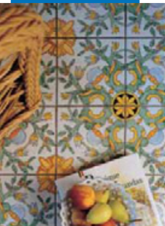
Пример шпаклевки половое покрытие из плитки двойного обжига

Вся необходимая справочная информация по материалу доступна по запросу, а также на сайте www.mapei.com