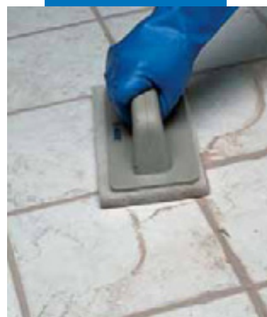
Очистка с помощью панели Scotch-Brite®