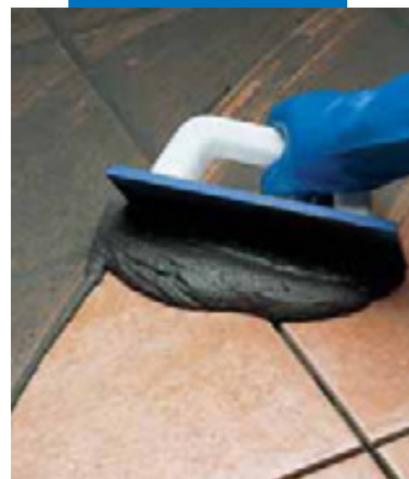
Заполнение швов в плитке на полу резиновым шпателем