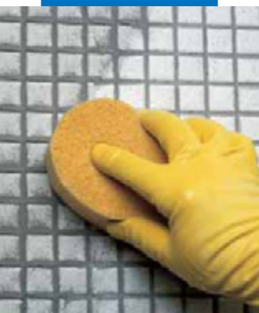
Очистка стеклянной мозаики губкой