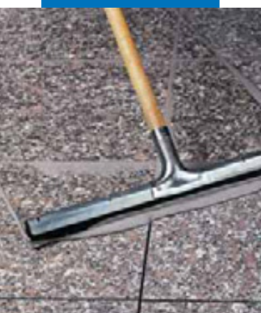
Заполнение швов в гранитных полах резиновой раклей